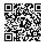
大学HP 2024年度からの学年暦

同志社大学では、2024年度から通常の教室での授業は13週の授業期間に受講し、残り2週分の授業はオンデマンドで受講することを基本とします。学期始めの1週間（Doshisha Opening Week "DO Week"）は、履修科目登録を行うオリエンテーション期間と初回のオンデマンド授業が並行する期間となります。履修要項やシラバス等を確認のうえ、授業1週目のオンデマンド授業を計画的に受講してください。詳細は大学HP ( https://www.doshisha.ac.jp/students/new_calender/index.html ) を参照ください。